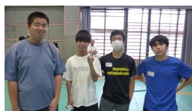
代表生徒 2年生 4名