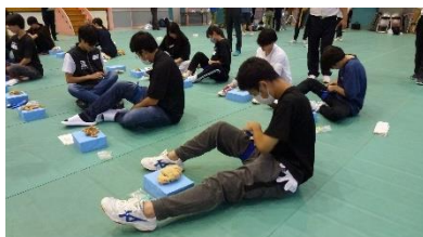
緊縛止血法訓練の様子