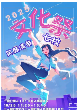
1年 我妻 隆真さんのポスター