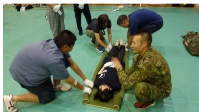
担架搬送訓練の様子

9月13日(土)仙台工業高校で「生徒の集い」が開催されました。「生徒の集い」とは、定時制通信制教育における生徒活動の促進を図る一環として毎年開催されるもので、県内の定時制通信制高等学校の代表生徒が集い、自主性を高めるとともに生徒相互の連帯感を深めることを目的としています。今年度は、仙台駐屯地陸上自衛隊から7名の自衛隊員の方を講師としてお招きし、担架搬送や緊縛止血法などの救護訓練、自衛隊の救急車両の見学、防災講話等のグループ活動を行いました。本校の代表生徒である2年生4名もそれぞれの訓練に積極的に参加していました。今回の研修で学んだことをみんなに伝え、いざという時に生かして欲しいと思います。