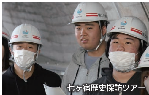
七ヶ宿歴史探訪ツアー