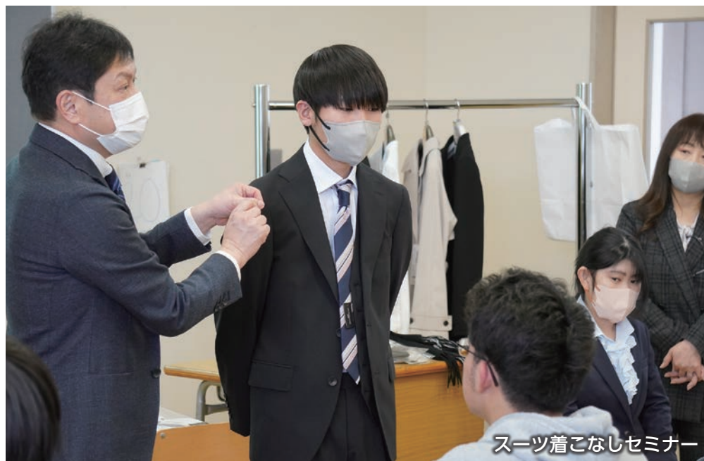
スーツ着こなしセミナー