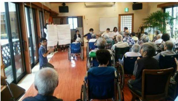
皆さん暖かく迎え入れてくださいました

8月26日(金), 「総合」音楽班に所属する生徒7名が, 特別養護老人ホーム「ゆりの里七ヶ宿」で慰問演奏会を行いました。お年寄りとの貴重な交流の機会を持つことができました。