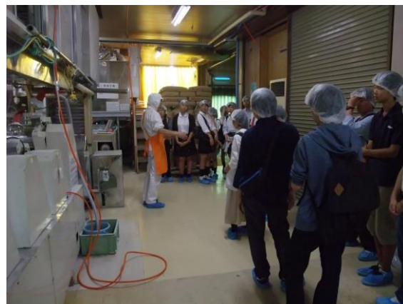
きちみ製麺で製造工程の説明を聞いています

9月2日(金)、全学年で職場見学を実施し、亶理町の「東北セキスイハイム」および白石市の「きちみ製麺」を訪問しました。就職試験を目前に控えている3年生を中心に、熱心に説明に耳を傾けていました。