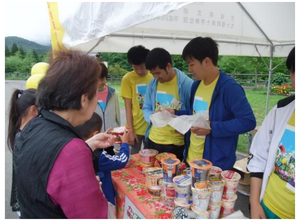
地域の方との交流ができました!

8月28日(日), 「七ヶ宿農林産物直売所旬の市」で, 西山学院高等学校の生徒とともに本校生徒6名がボランティア活動を行いました。街頭募金の呼びかけ, Tシャツの販売などのお手伝いをしました。