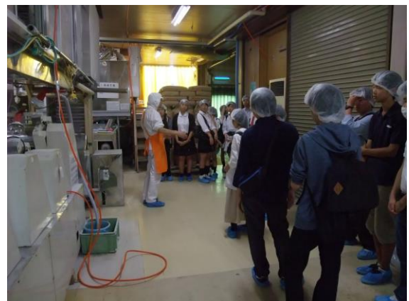
きちみ製麺で製造工程の説明を聞いています

9月2日(金), 全学年で職場見学を実施し, 亶理町の「東北セキスイハイム」および白石市の「きちみ製麺」を訪問しました。就職試験を目前に控えている3年生を中心に, 熱心に説明に耳を傾けていました。