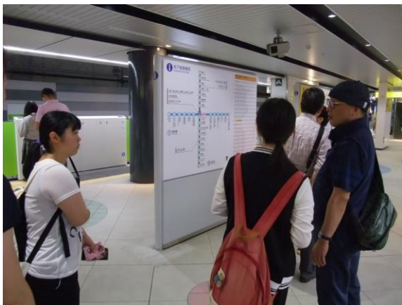
次の目的地までの行き方を相談しています

今年度の内容は、5～6名の班に分かれた生徒たちが、仙台市地下鉄南北線・東西線を利用してオリエンテーリングを行いました。本校からは3名の生徒が参加しています。他校の生徒たちとも交流を深めたようです。