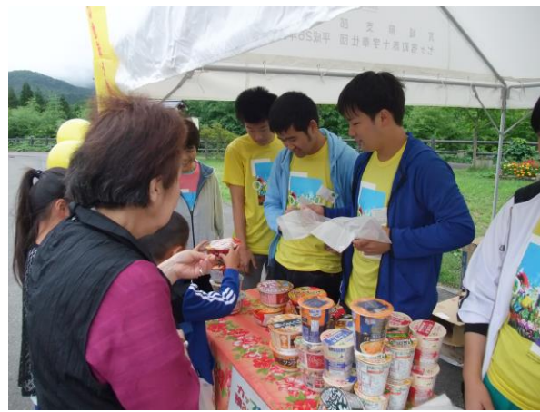
地域の方との交流ができました！

8月28日(日)、「七ヶ宿農林産物直売所旬の市」で、西山学院高等学校の生徒とともに本校生徒6名がボランティア活動を行いました。街頭募金の呼びかけ、Tシャツの販売などのお手伝いをしました。