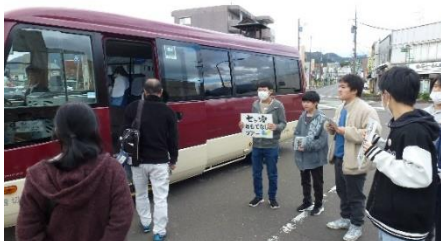
バスへの乗車を案内する様子

11月3日(月)総合的な探究の時間の一環として、広報班が4月より準備を進めてきました「七ヶ宿おもてなしツアー(略称SOT)」を実施しました。10時に白石駅に集合し、バスで「街道HOSTELおたて」に移動、そば打ち体験を行いました。ちょっと太さがバラバラになりましたが、おいしいおそばができました。その後は学校に移動して学校紹介とLHRを体験してもらいました。最後は道の駅の隣の「無限陶房」さんにて陶芸体験をしてもらい、道の駅でお土産を購入し、一路帰路へとつきました。次年度へ向けて課題も見つかりましたが、概ね当初の目的を達成することができました。