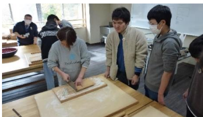
そば打ち体験の様子