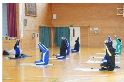
3年生ポーズの様子