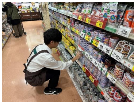
商品の陳列作業の様子