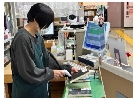
本の貸し出し作業の様子