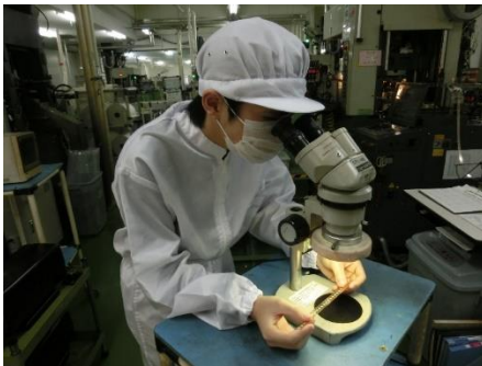
製品の動作確認の様子